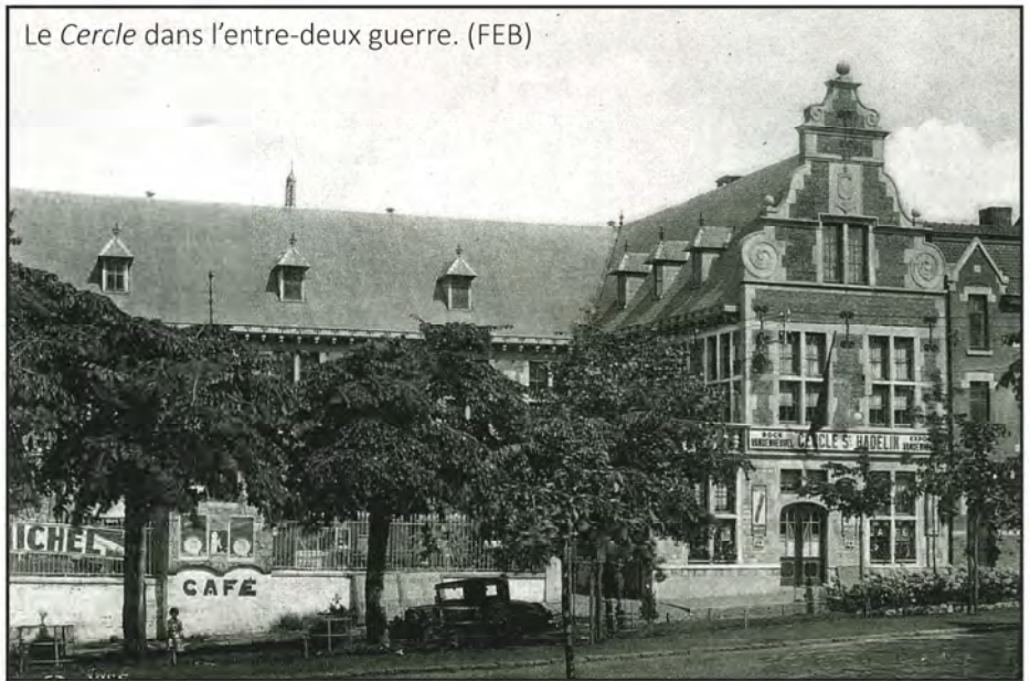
Le Cercle dans l'entre-deux guerre. (FEB)