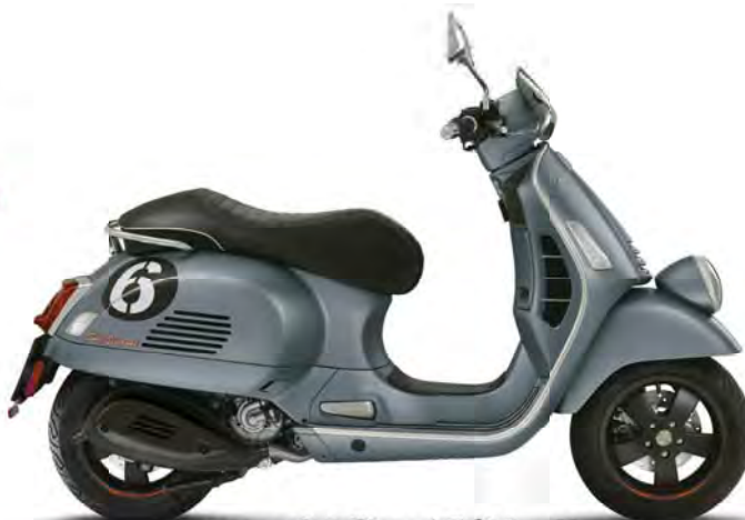
Vespa Sei Giorni Edition II

Ouvert du mardi au vendredi de 9h à 12h & de 13h à 18h. Le samedi de 8h à 12h et de 13h à 15h. Fermé le lundi. Rue de Tongres 8 - 4600 Visé - 04.379.34.78 - raffaygarage@gmail.com